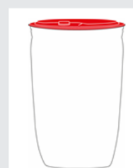
Bidon 5 l Art. no.: 2004620