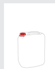
Bidon 12 kg Art. no.: 2001483